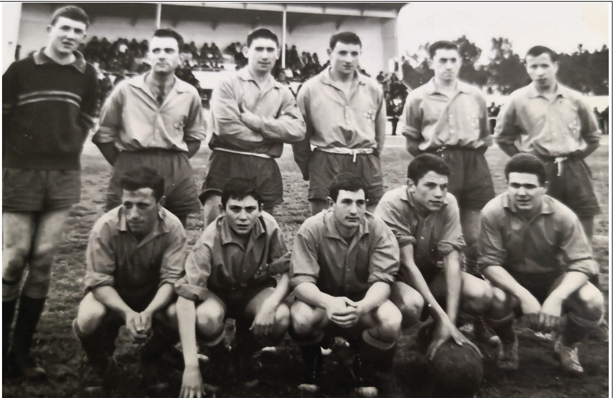
Foto de época: Fiestas de 1 de mayo de 1963. Equipo de solteros de Calvo Sotelo.

Se enfrentó al de casados venciendo por 2-0.